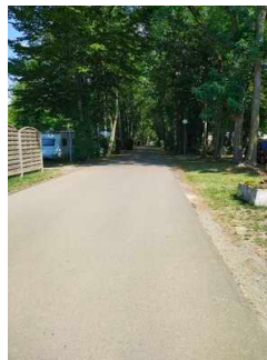
Wege auf dem Campingplatz