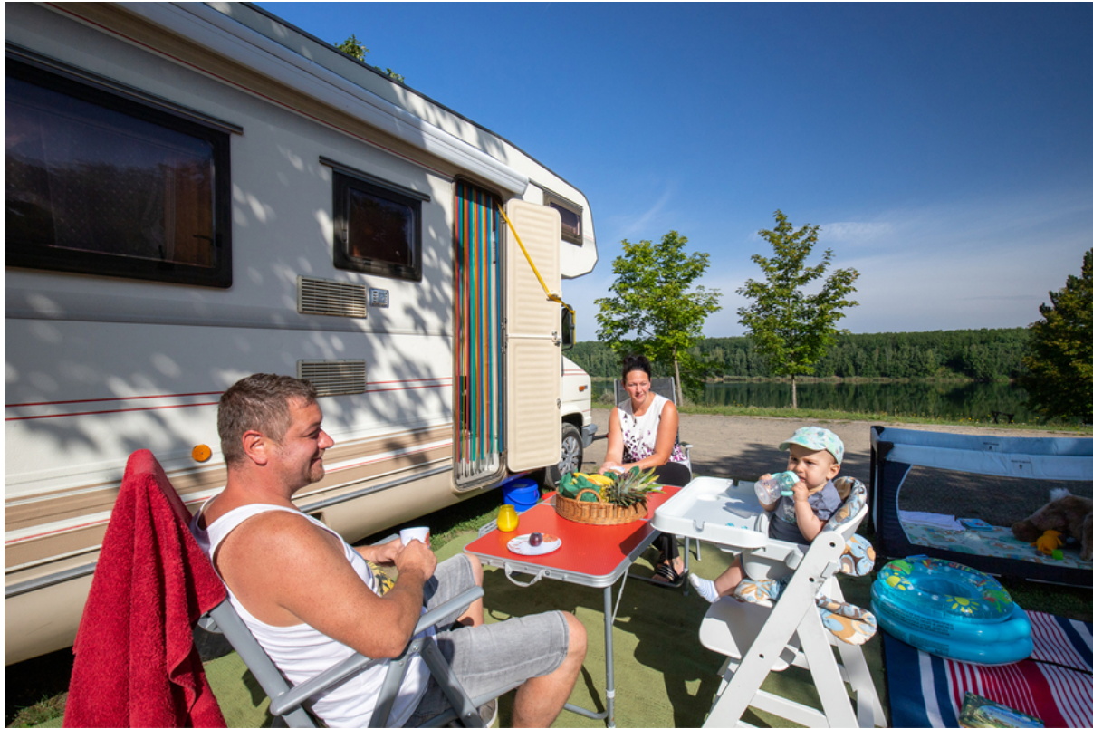
See-Camping Altenburg Pahna | Campingpark Pahna