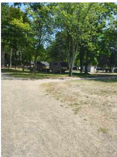
Wege auf dem Campingplatz