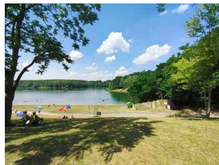
See / Wasserzugang